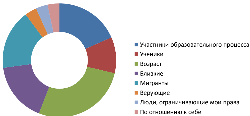
Рисунок 1. Субъекты проявления толерантного отношения у педагогов

Ответы, полученные на этот вопрос, с помощью процедуры контент-анализа были классифицированы и проранжированы (рисунок 1).