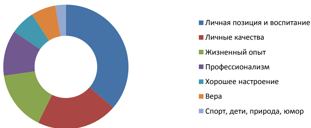
Рисунок 3. Факторы, способствующие проявлению толерантности у педагогов

Наглядно полученные данные представлены на рисунке 3.