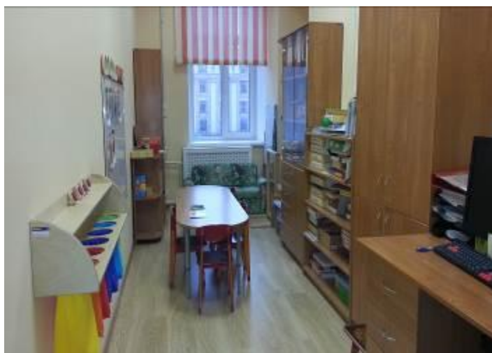
Кабинет учителя-дефектолога № 1