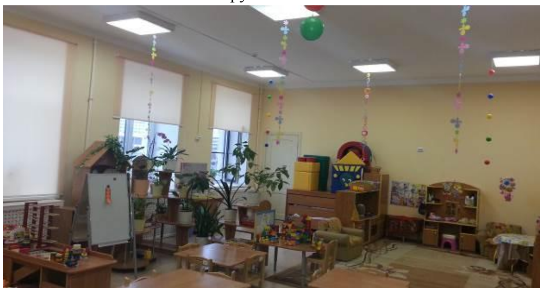
Группа № 2 «Звездочки»