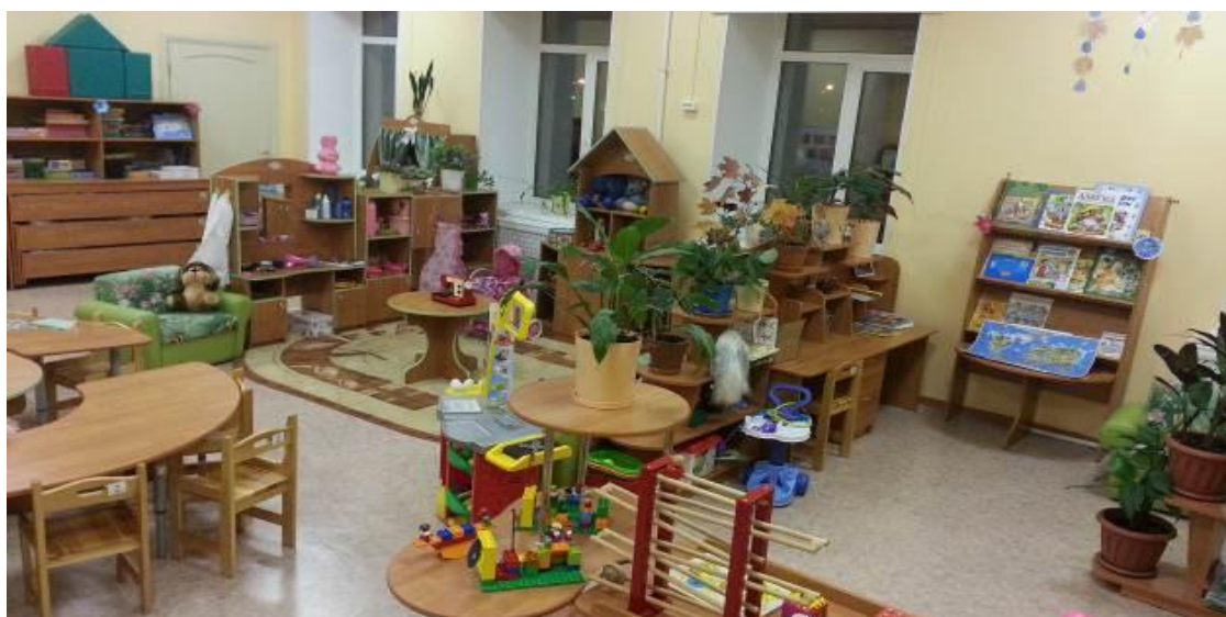
Группа № 1 «Гномики»

В детском саду оборудованы светлые групповые помещения: