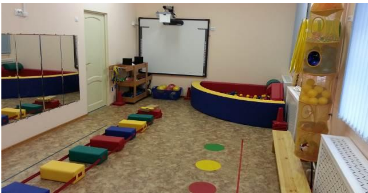
Зал лечебной физкультуры

Современные новинки спортивного, дидактического и мультимедийного оборудования в зале лечебной физкультуры используются для работы, направленной на всестороннее физическое развитие, укрепление здоровья ребенка и формирование представлений о здоровом образе жизни.