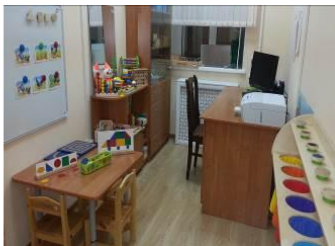
Кабинет учителя-дефектолога №