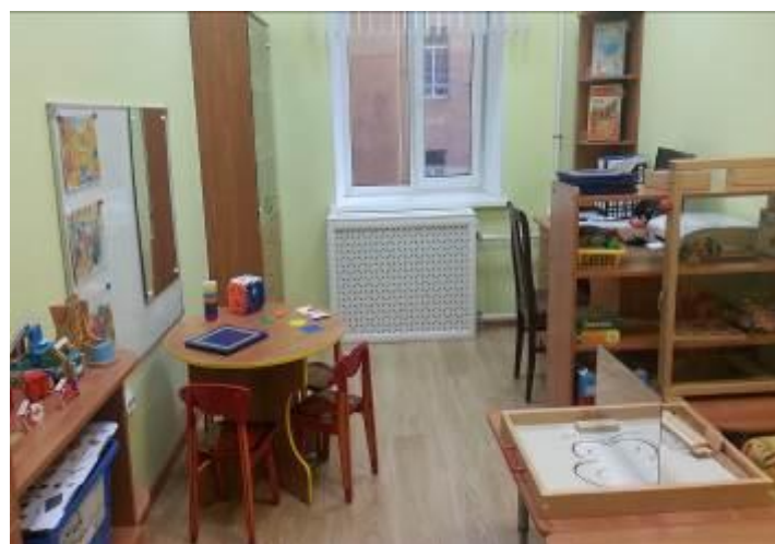
Кабинет учителя-дефектолога № 2