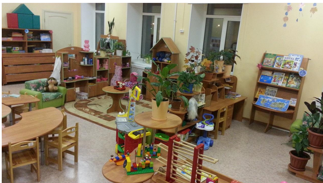
Группа № 1 «Гномики»

В детском саду оборудованы светлые групповые помещения: