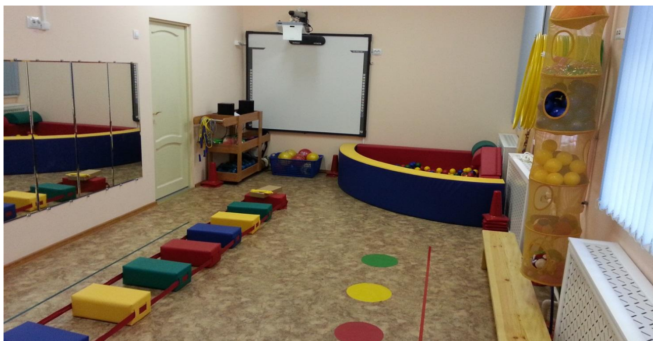
Зал лечебной физкультуры

Современные новинки спортивного, дидактического и мультимедийного оборудования в зале лечебной физкультуры используются для работы направленной на всестороннее физическое развитие, укрепление здоровья ребенка и формирование представлений о здоровом образе жизни.