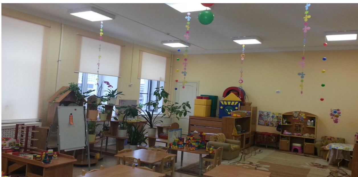
Группа № 2 «Звездочки»

Кабинеты учителей-дефектологов и логопеда оснащены современным техническим и методически оборудованием и используются как для подгрупповой так и для индивидуальной коррекционной работы с детьми.