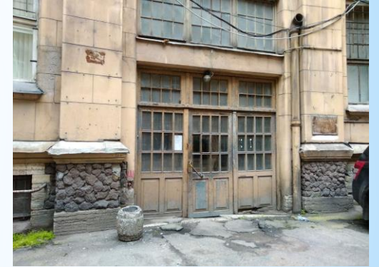
Садовая улица, 55-57 (во дворе)

Начальник пожарной части (Профилактической)